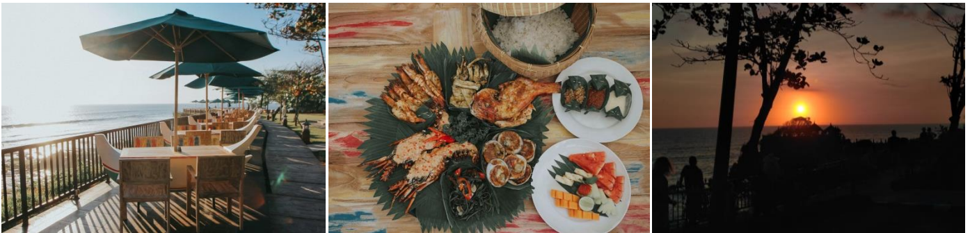
พักที่ THE ANVAYA RESORT BALI (ระดับ 5 ดาว) หรือเทียบเท่า