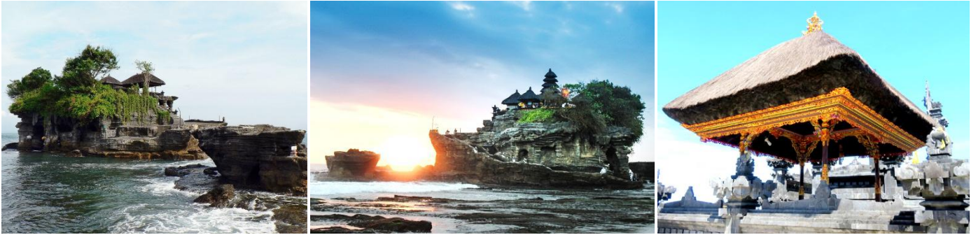
คำ บริการอาหารค่ำ ณ DE JUKUNG RESTAURANT พร้อมชมวิวพระอาทิตย์ตกดิน

เป็น 1 ใน 7 วัด ที่ถูกสร้างริมชายฝั่งทะเลของเกาะบาหลี ถูกสร้างขึ้นในช่วงศตวรรษที่ 15-16 เพื่ออุทิศแด่เทพเจ้าและปีศาจแห่งท้องทะเล